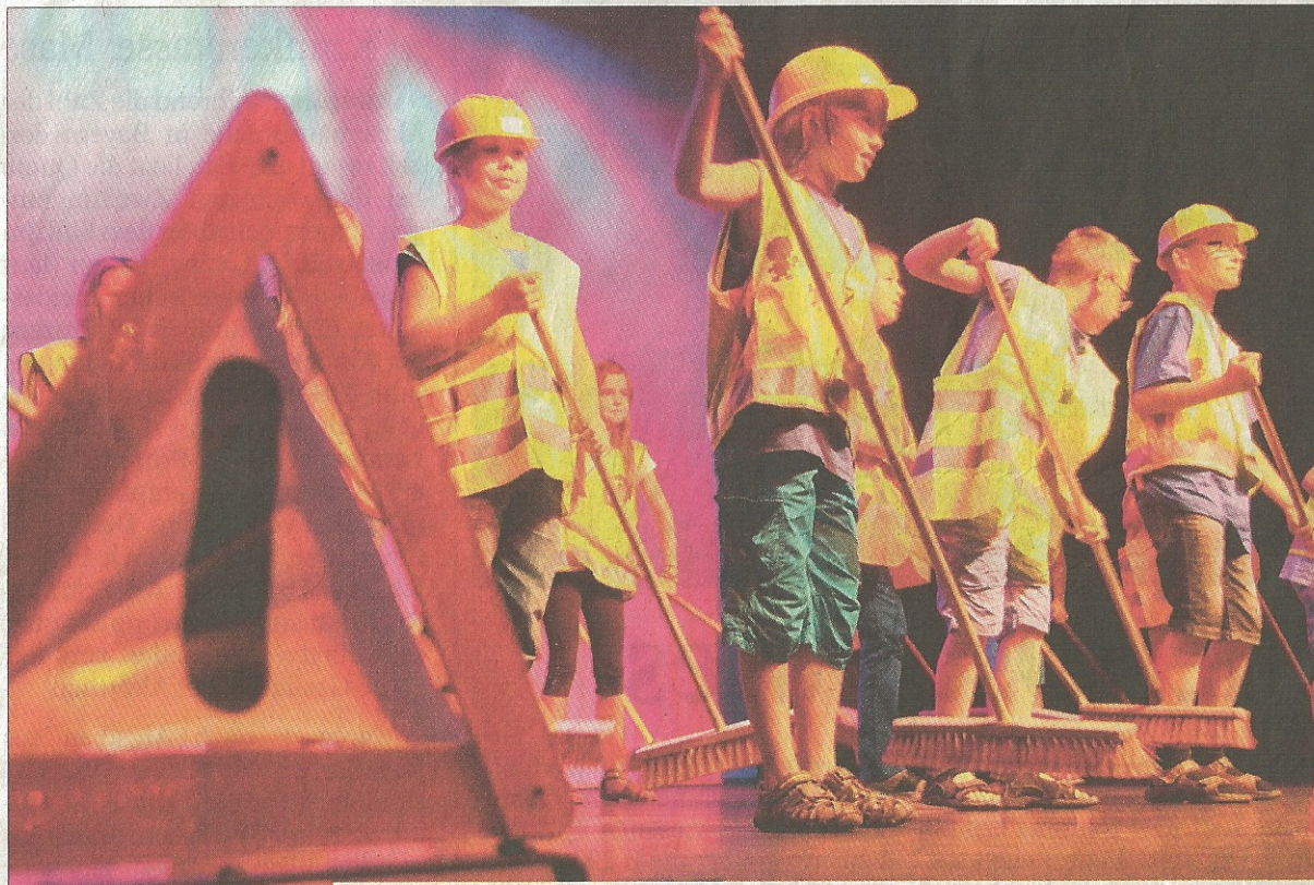
Kehren für den guten Zweck: Der Besentanz der Klasse 3a.

Bürgermeister Peter Haugeneder unterstrich, dass das gesammelte Geld nicht an die Schule selbst geht, damit das Gebäude dort wieder in Stand gesetzt wird, sondern dass die Eltern und Kinder davon profitieren werden. „Für das andere muss der Sachaufwandsträger sorgen.“ Zudem stellte er eine Spende der Stadt in Aussicht. „Wenn der Betrag feststeht, wird sich Neuötting noch daran